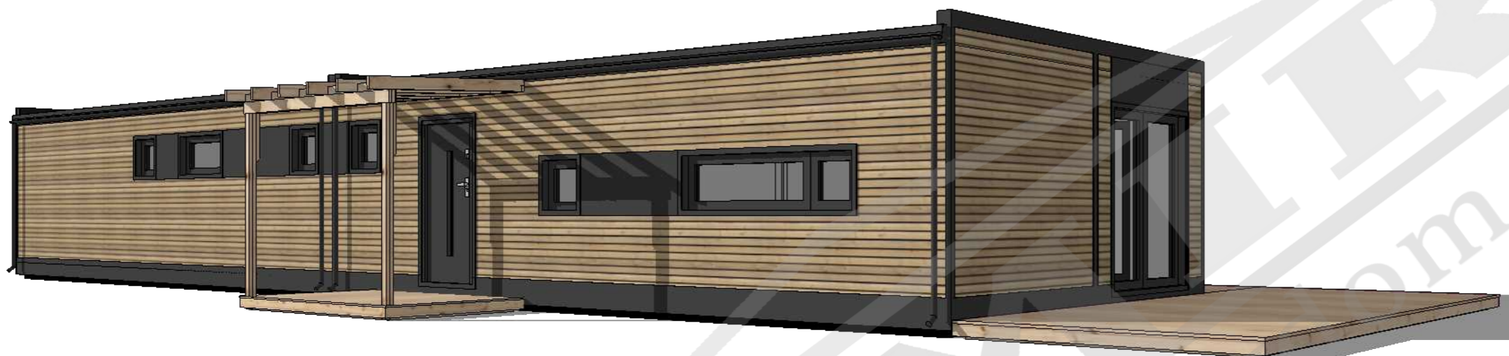
Widok 3d modułu GRANERO 120,07m 2 (kąt nachylenia dachu 3 stopnie)